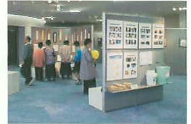
絵画、ポスター展示などに